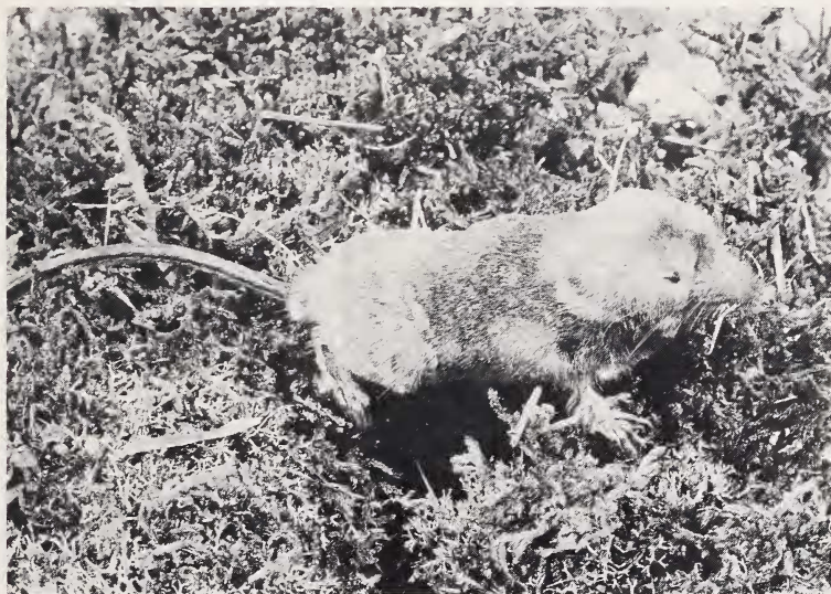
Fig. 2. Neomys fodiens (Pennant, 1771) atteinte d'albinisme. L'animal, une femelle adulte, était lors de sa capture de couleur blanc sale, seule subsistait la zone foncée située sur la ceinture scapulaire et sur la tête (cliché J. LECOMTE, C.N.R.S., d'après animal mort)

On connaît de nombreux cas européens de mélanisme total ou partiel pour le genre Neomys ( N. fodiens , N. anomalus ): Allemagne (JACOBI 1928; KAHMANN et ROSSNER 1956; SCHÖBER 1959); Autriche (BAUER 1960); Finlande (SKAREN 1973); Grande-Bretagne (CROWCROFT 1957); Pays-Bas (HUSSON 1947; VAN LAAR et VAN LAAR 1966); France (GIBAN 1956; SAINT GIRONS 1963) entre autre. En revanche, les individus présentant un albinisme total ou partiel sont inconnus à notre connaissance. Les spécimens montrant une bordure de l'oreille ou une extrémité de la queue blanche (CORBET 1963; SAINT GIRONS 1963), caractère qui peut-être commun chez certaines populations, ne sont pas à considérer comme individus affectés d'albinisme. De plus, nous savons que la présence des petites taches blanches dans la région du cou ne présente pas un cas d'albinisme partiel. Ces taches, toujours localisées sur des femelles adultes, résultent des morsures du mâle pendant la copulation (CROWCROFT 1957). Notons toutefois que ces taches n'apparaissent pas dans